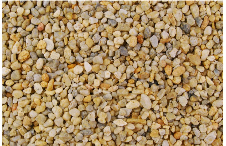
SRK110 Beige 4-8mm