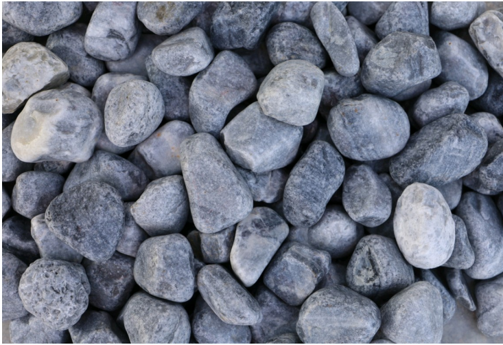
STV 250D Blau Grau 4-8mm, 8-12mm

Natursteine für die Herstellung von Stellar Steinteppiche