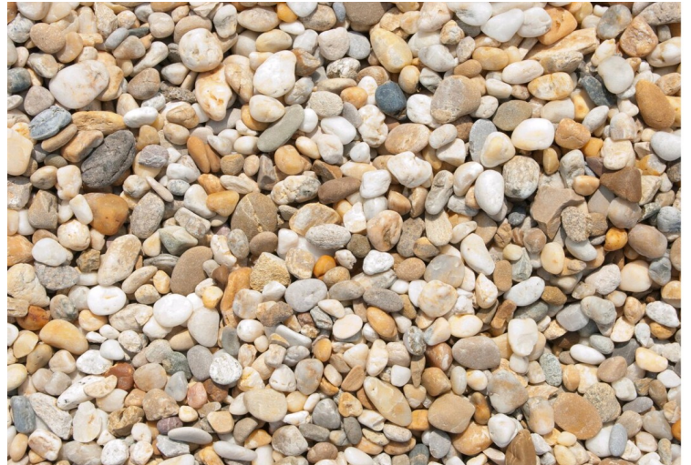
SRK 130 Bunt 6-8mm