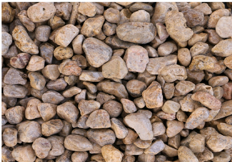
STV 230D Camel 4-8mm, 5-12mm, 8-12mm