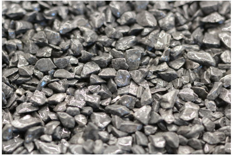
STV 200 Grau-Antra 3-8mm, 5-12mm