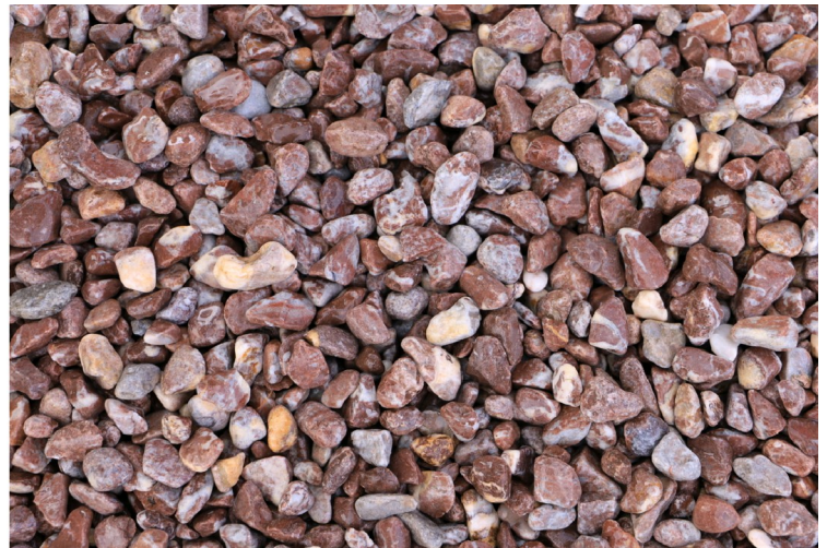
STV 220 2-4mm, 4-8mm