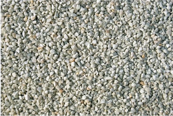
SPF100 Grau 2-4mm, 4-8mm

Natursteine für die Herstellung von Stellar Steinteppiche