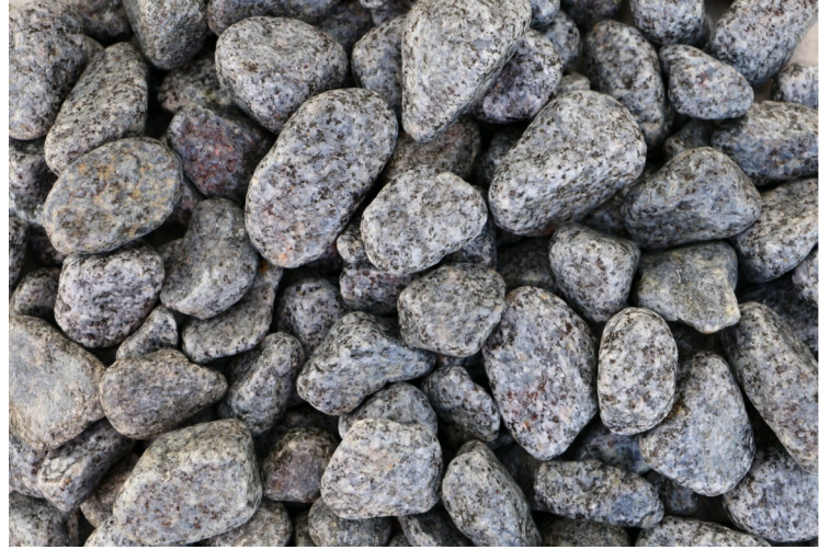
STV 260 Granit 3-8mm, 8-12mm