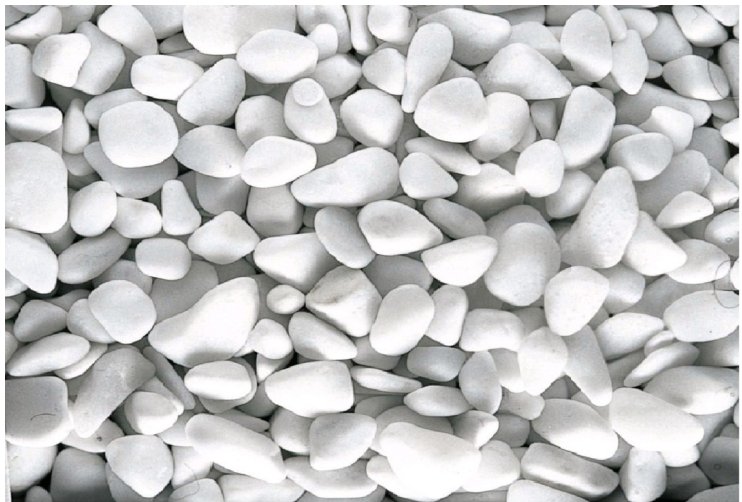
STV 210D Weiß 2-4mm 4-8mm