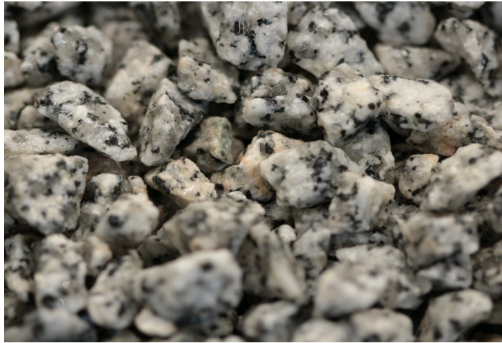
STV 270 Granit 3-8mm, 8-12mm