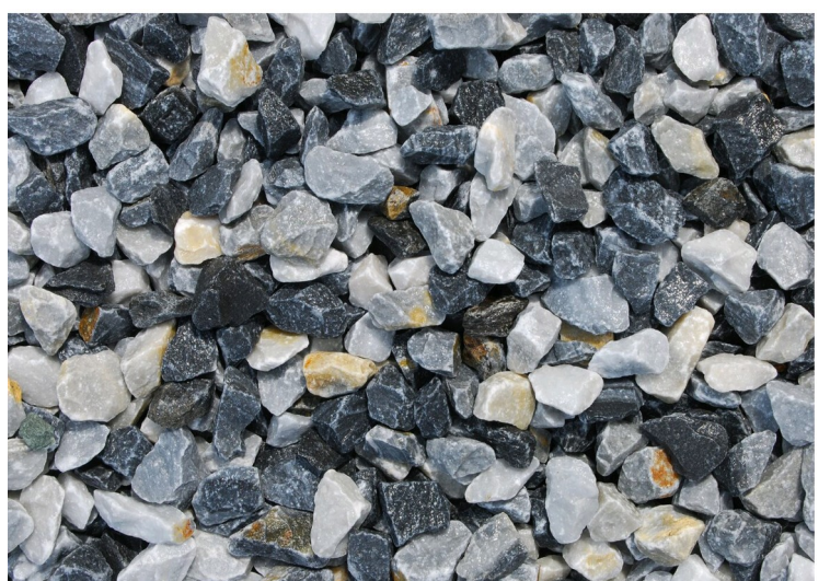
SDS 150 Grau Mix 8-16mm