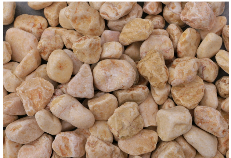
STV 240D Rosine 2-4mm, 4-8mm