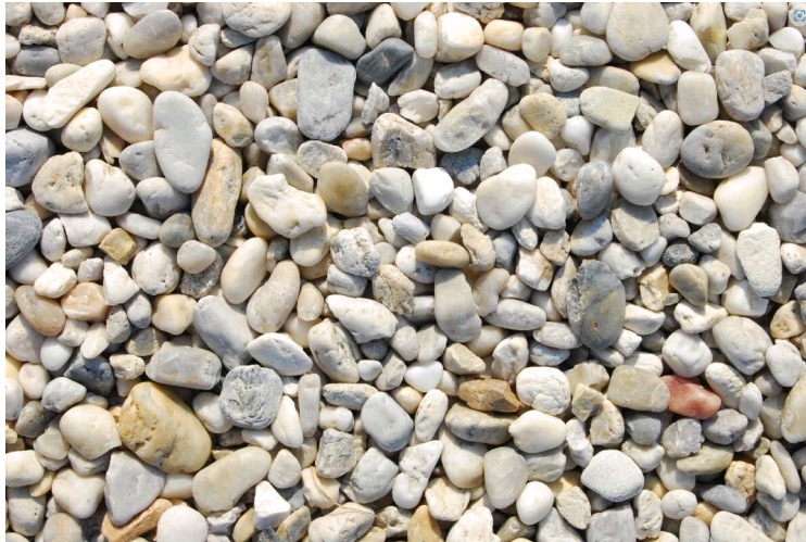
SPK 160 Bunt 8-16mm

Natursteine für die Herstellung von Stellar Steinteppiche